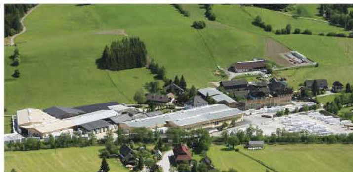
Das Brettspertholzwerk Unternberg: Eine Erfolgsgeschichte der Firma binderholz. Mit neuem Produkt zum Erfolg.

Aufgrund der hervorragenden Eigenschaften von Brettspertholz, in der Verwendung als massives Bauelement für Wand-, Decken- und Dachkonstruktionen im modernen Massivholzbau, werden mittlerweile Bauprojekte aller